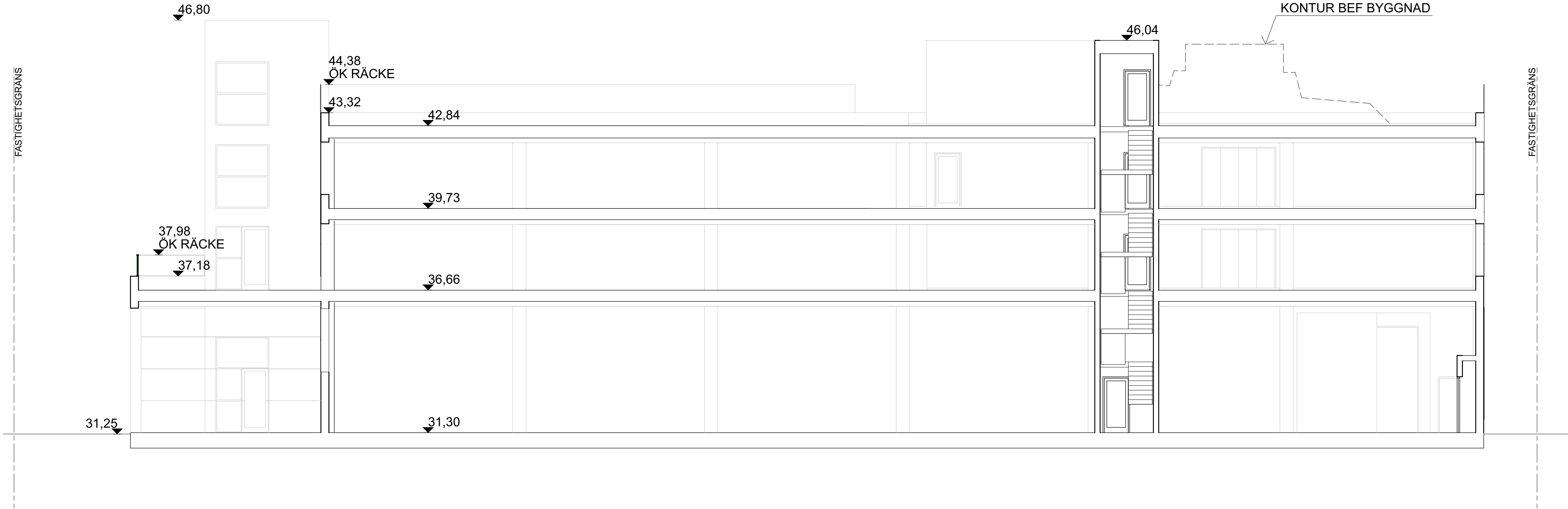
Sektion A 1:100